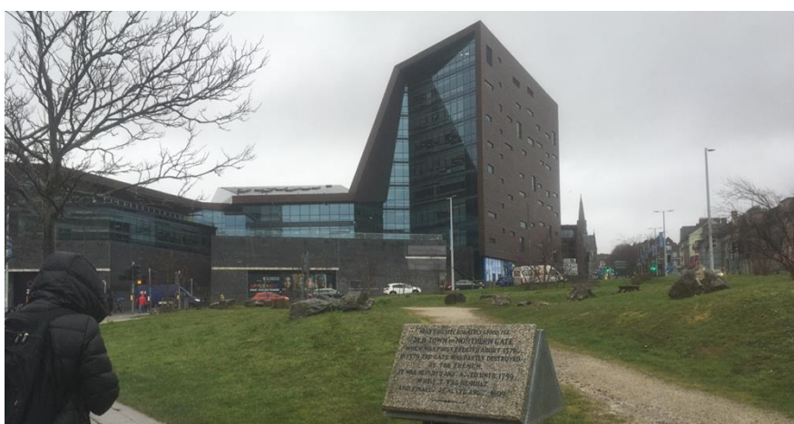
Tako pa izgleda Univerza v Plymouthu.

Francis Drake je bil angleški morjeplovec, gusar, politik in gradbeni inženir iz 16. stoletja. Njegov grafit pa je razstavljen v cerkvi St. Andrewa.