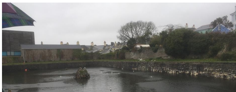
Vrt v lasti univerze v Plymouthu - Drake's Place

Po izobraževanju je sledil kratek ogled mesta v avtohtonih vremenskih pogojih: dež in veter. Nekaj časa smo vztrajali, a smo na koncu vendarle priznali premoč vremenu in ogled skrajšali. Posledično je je slikovnega materiala malo.