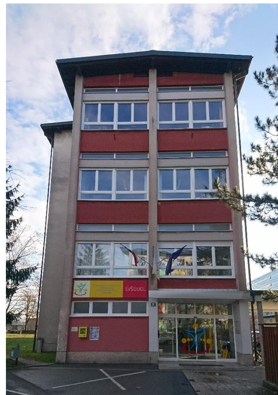
Kardeljeva ploščad 28a, kjer bo potekala poklicna matura