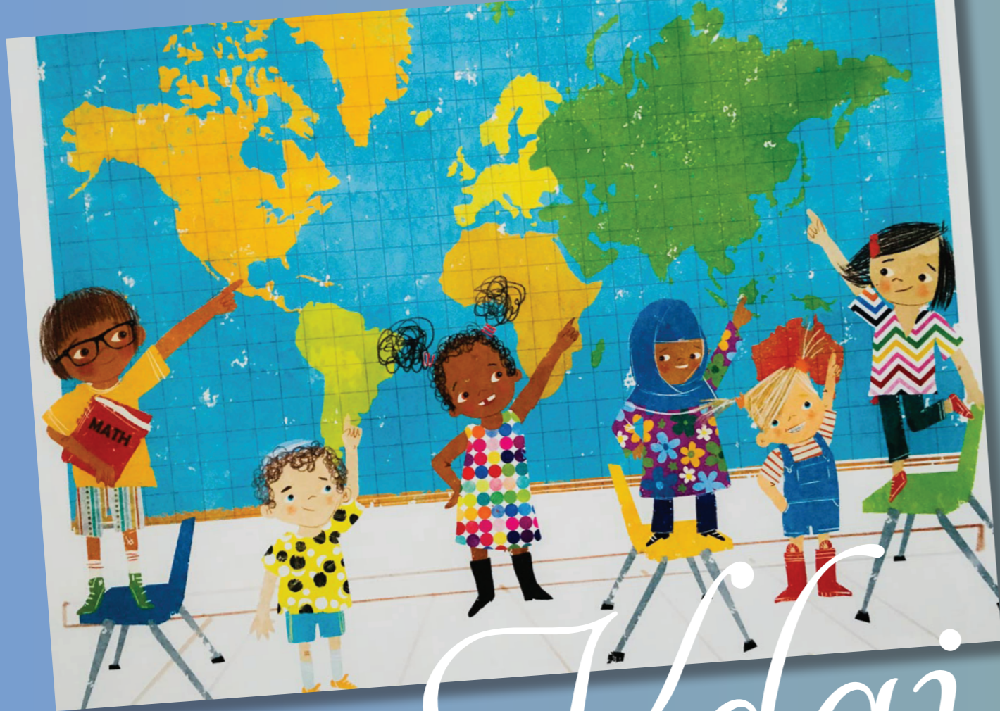
Eva Pintar, 3. F